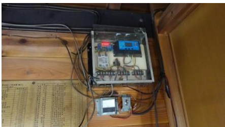
コントローラー交換