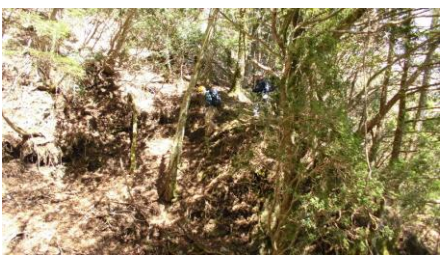
地蔵岳捲き道を進む