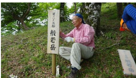
般若岳の靡看板交換