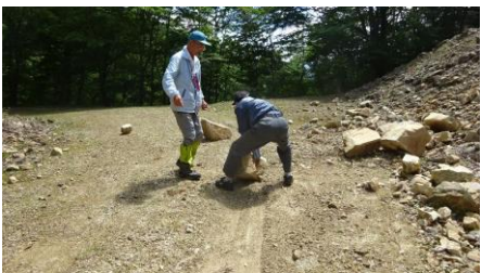
落石を除けながら

ちょうどいい具合に同じような場所でも一つの事案が重なったので、同時に二つをこなすことになった。