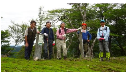
般若岳の靡看板交換