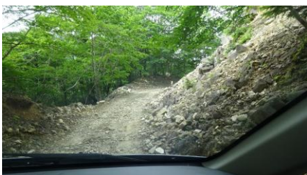
大きな倒木があった場所